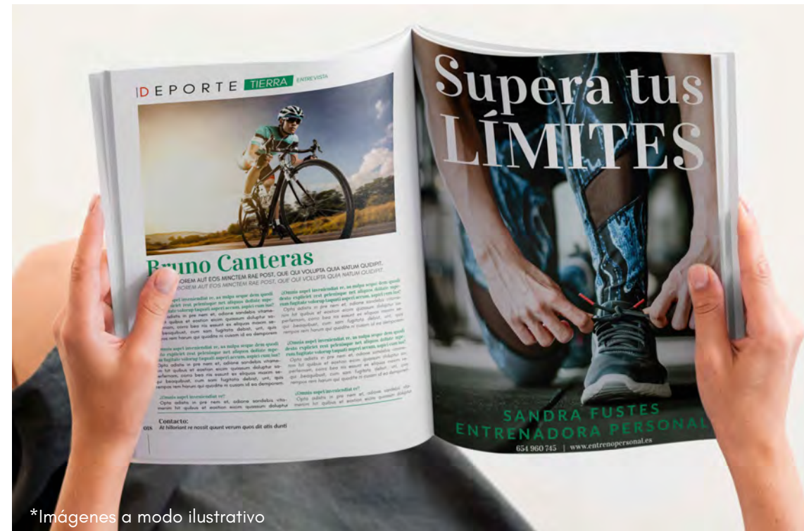
*|Imágenes a modo ilustrativo

Activa't tiene voz propia. Y esta voz estará representada por un equipo que trabaja para ofrecer información a personas ávidas de consumir información, productos y servicios.